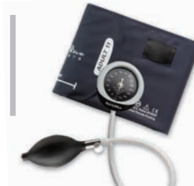
DS45 Integrerad manometer #DS45-11

5 ÅRS KALIBRERINGSGARANTI • 76 CM STÖTSÄKERHET • 5 ÅRS KALIBRERINGSGARANTI • 76 CM STÖTSÄKERHET