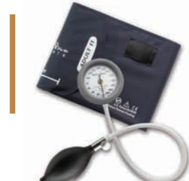
DS44 Integrerad manometer #DS44-11