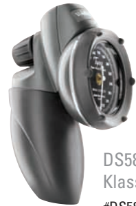
DS58 Tycos® Klassisk manometer #DS58-11