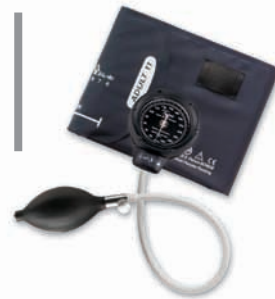
DS48A Tycos® Klassisk integrerad manometer #DS48A-11

15 ÅRS KALIBRERINGSGARANTI • 76 CM STÖTSÄKERHET • 15 ÅRS KALIBRERINGSGARANTI • 76 CM STÖTSÄKERHET